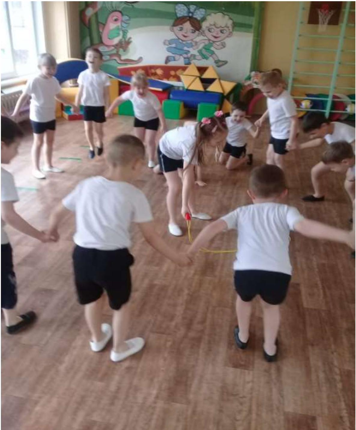
«Ловись рыбка большая и маленькая»